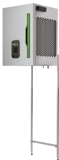
T.One® Air T.One® Air R32

Solution innovante et sur-mesure pour se chauffer confortablement