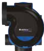
Groupe en vue de dessus