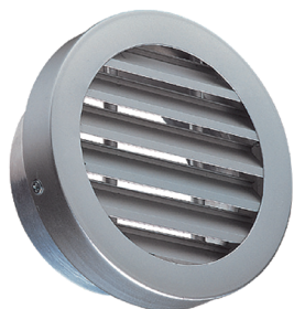
AR637 F0 D200

La rejilla exterior circular mural AR 637 permite la toma de aire o descarga de aire viciado sin riesgo de entrada de lluvia gracias a la forma de las aletas.