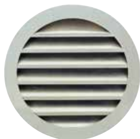
Rejilla AR 637

La rejilla exterior circular mural AR 637 permite la toma de aire o descarga de aire viciado sin riesgo de entrada de lluvia gracias a la forma de las aletas.