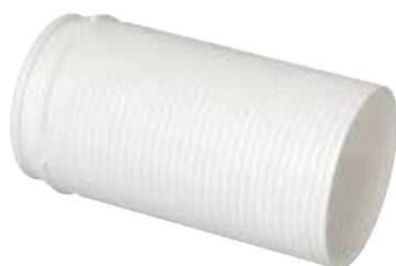
Alargador circular Ø80 mm

Alargador Miniconducto blanco equivalente Ø80 (40x100) largo 150