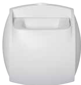
Bap'SI simple caudal sanitario

La boca BAP'SI Simple Caudal Sanitario es la solución ideal para viviendas nuevas, ya que permite garantizar un caudal de aire constante sean cuales sean las condiciones de la vivienda.