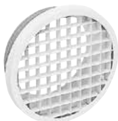
BEM 780 Ø160

El pequeño terminal BEM 780 permite el retorno de aire en los pequeños locales terciarios con una baja pérdida de carga.