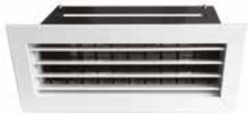
Boca motorizada T.One® L200xH100 negra y blanca