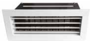
Boca motorizada T.One® L700xH100 negra y blanca