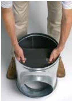
Instalación del deflector acústico y aeráulico en la caja injerto