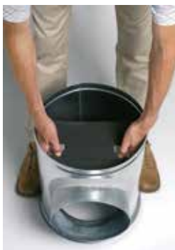
Instalación del deflector acústico y aeráulico en la caja injerto