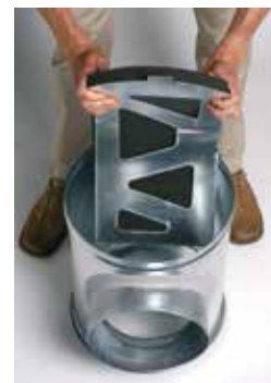
Instalación del deflector acústico y aeráulico en la caja injerto