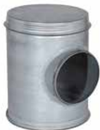
Caja injerto con juntas

El CP con juntas asegura la unión y la accesibilidad de la red colectora vertical y de la red horizontal asegurando al mismo tiempo una estanqueidad clase C.