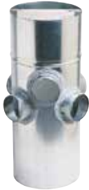
Colector Conexión de Planta multivivienda

La CRE multivivienda permite conectar dos viviendas de un mismo nivel a una misma columna vertical.