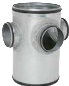
Colector Conexión de Planta con juntas

La CRE con juntas permite conectar de 1 a 3 injertos de diámetro 125 en la columna vertical asegurando al mismo tiempo una estanqueidad clase C.