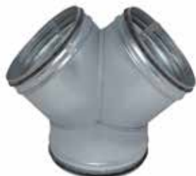
Pantalón Simple 90° con juntas

El CS 90° con juntas permite asegurar la confluencia de 2 ramales de red galvanizada a 90° la una de la otra asegurando al mismo tiempo una estanqueidad clase C.