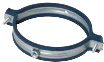
CU galva antivibratoria