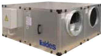
CXc3000 version horizontal - Vista lateral

La unidad CXc 3000H es la solución de tratamiento de aire de doble flujo de techo, silenciosa y modulable para locales terciarios.