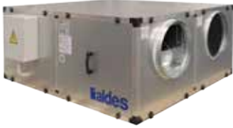
CXc3000 version horizontal - Vista lateral

La unidad CXc 3000H es la solución de tratamiento de aire de doble flujo de techo, silenciosa y modulable para locales terciarios.