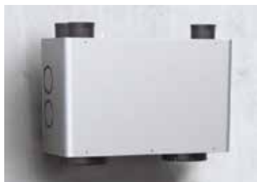
Caja de distribución InspirAIR® Side