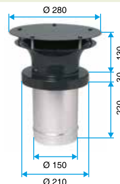
Encombremet sortie ronde pour tuile à douille