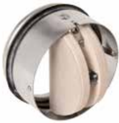
Cartucho CT con boca

Los cartuchos cortafuego CT-1 y CT-2 sirven para impedir la propagación del fuego mediante el cierre del conducto de aire a la altura de las estructuras antincendio. Estos cartuchos se han previsto para su uso en edificios terciarios e industriales.