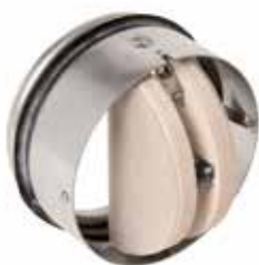
Cartucho CT con boca

Los cartuchos cortafuego CT-1 y CT-2 sirven para impedir la propagación del fuego mediante el cierre del conducto de aire a la altura de las estructuras antincendio. Estos cartuchos se han previsto para su uso en edificios terciarios e industriales.