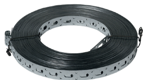
Rollo de cinta perforada