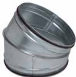
Codo 30° con juntas

El codo 30° con juntas permite cambiar la dirección de una red galvanizada de 30° asegurando al mismo tiempo una estanqueidad clase C.