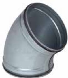
Codo 45° con juntas

El codo 45° con juntas permite cambiar la dirección de una red galvanizada de 45° asegurando al mismo tiempo una estanqueidad clase C.