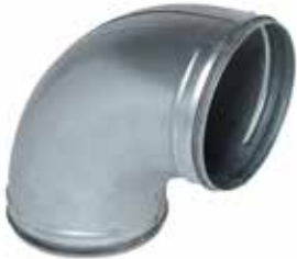
Codo 90° con juntas

El codo 90° con juntas permite cambiar la dirección de una red galvanizada de 90° asegurando al mismo tiempo una estanqueidad clase C.