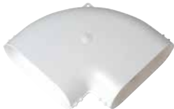
Codo horizontal 90°