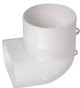
Codo mixto para boca Ø80 mm