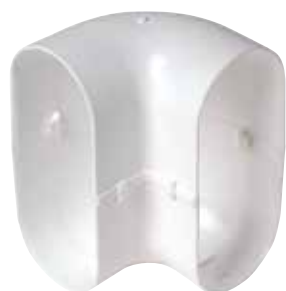
Codo vertical 90°