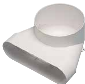
Codo 90° vertical para boca