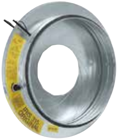
Compuerta con Iris

La compuerta con Iris permite equilibrar finamente una red circular garantizando al mismo tiempo una tasa de fuga muy baja (estanqueidad clase C).