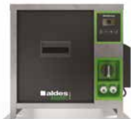
EasyVEC-C4 ULTIMATE 1000