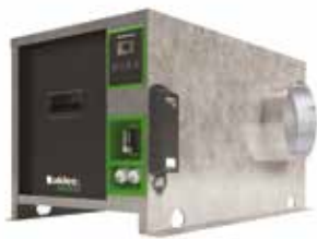
EasyVEC-C4 ULTIMATE 1000

La gama de cajas simple flujo con el mejor diseño del mercado para una ventilación eficiente, serena y fácil.