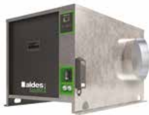
EasyVEC-C4 ULTIMATE 1500

La gama de cajas simple flujo con el mejor diseño del mercado para una ventilación eficiente, serena y fácil.