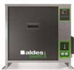
EasyVEC-C4 ULTIMATE 1500