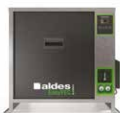
EasyVEC-C4 ULTIMATE 1500