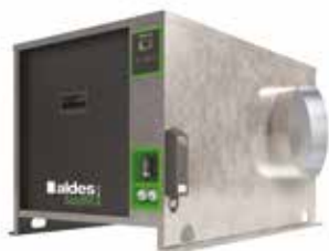
EasyVEC-C4 ULTIMATE 1500

La gama de cajas simple flujo con el mejor diseño del mercado para una ventilación eficiente, serena y fácil.