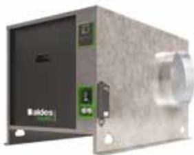
EasyVEC-C4 ULTIMATE 2500

La gama de cajas simple flujo con el mejor diseño del mercado para una ventilación eficiente, serena y fácil.