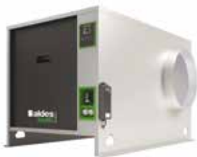
EasyVEC-C4 ULTIMATE 2500 RAL9006