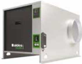
EasyVEC-C4 ULTIMATE 2500 RAL9006