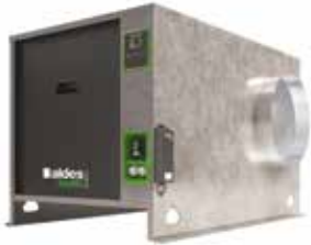
EasyVEC-C4 ULTIMATE 2500

La gama de cajas simple flujo con el mejor diseño del mercado para una ventilación eficiente, serena y fácil.