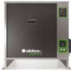
EasyVEC-C4 ULTIMATE 4000