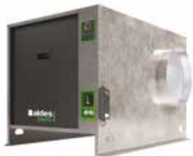
EasyVEC-C4 ULTIMATE 4000

La gama de cajas simple flujo con el mejor diseño del mercado para una ventilación eficiente, serena y fácil.