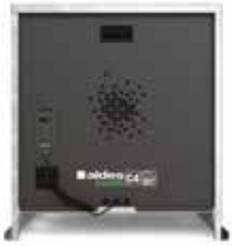
EasyVEC-C4 micro-watt + 4000

La gama de cajas simple flujo con el mejor diseño del mercado para una ventilación eficiente, serena y fácil.