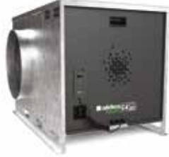
EasyVEC-C4 micro-watt + 4000