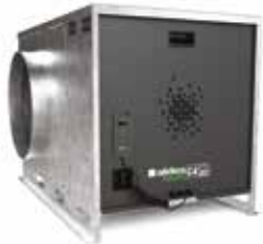
EasyVEC-C4 micro-watt + 4000