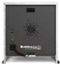
EasyVEC-C4 micro-watt + 4000

La gama de cajas simple flujo con el mejor diseño del mercado para una ventilación eficiente, serena y fácil.