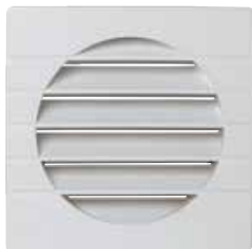
GEB de 125 mm