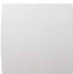
GRAPHIC vista frontal