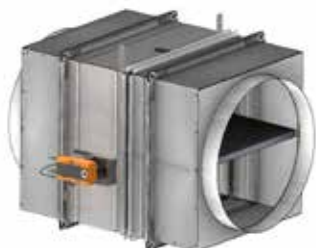
ISONE 2 circular Europe autocomandada