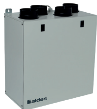
InspirAIR® Top 210 - Vistal Lateral

El VMC de doble flujo más compacto del mercado