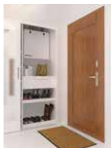
InspirAIR® Top 210