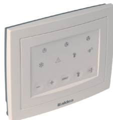
Telemando InspirAIR® Top 210