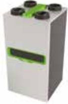
InspirAIR® Top 450 Classic

La solución doble flujo que filtra de manera eficaz los contaminantes más finos y se adapta a sus necesidades