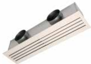
Rejilla LINED Combined