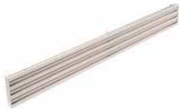
LINED SLIM E RETORNO

La Serie LINED® Slim es un difusor lineal de aluminio de vías regulables sin marco para la difusión o el retorno de aire para edificios terciarios.