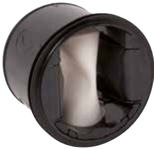
MR Mono HP

El MR Mono Alta Presión es un regulador de caudal que garantiza un caudal estable a alta presión para controlar CAI, confort y ahorro de energía del local.