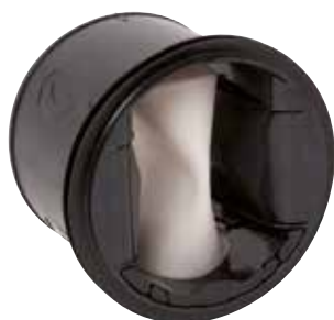
MR Mono HP

El MR Mono Alta Presión es un regulador de caudal que garantiza un caudal estable a alta presión para controlar CAI, confort y ahorro de energía del local.