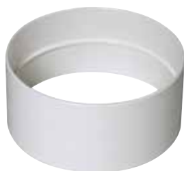
Manguito hembra Ø125 mm

Manguito Miniconducto blanco hembra para conducto equivalente Ø125