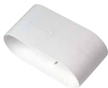
Manguito hembra 40x100 mm